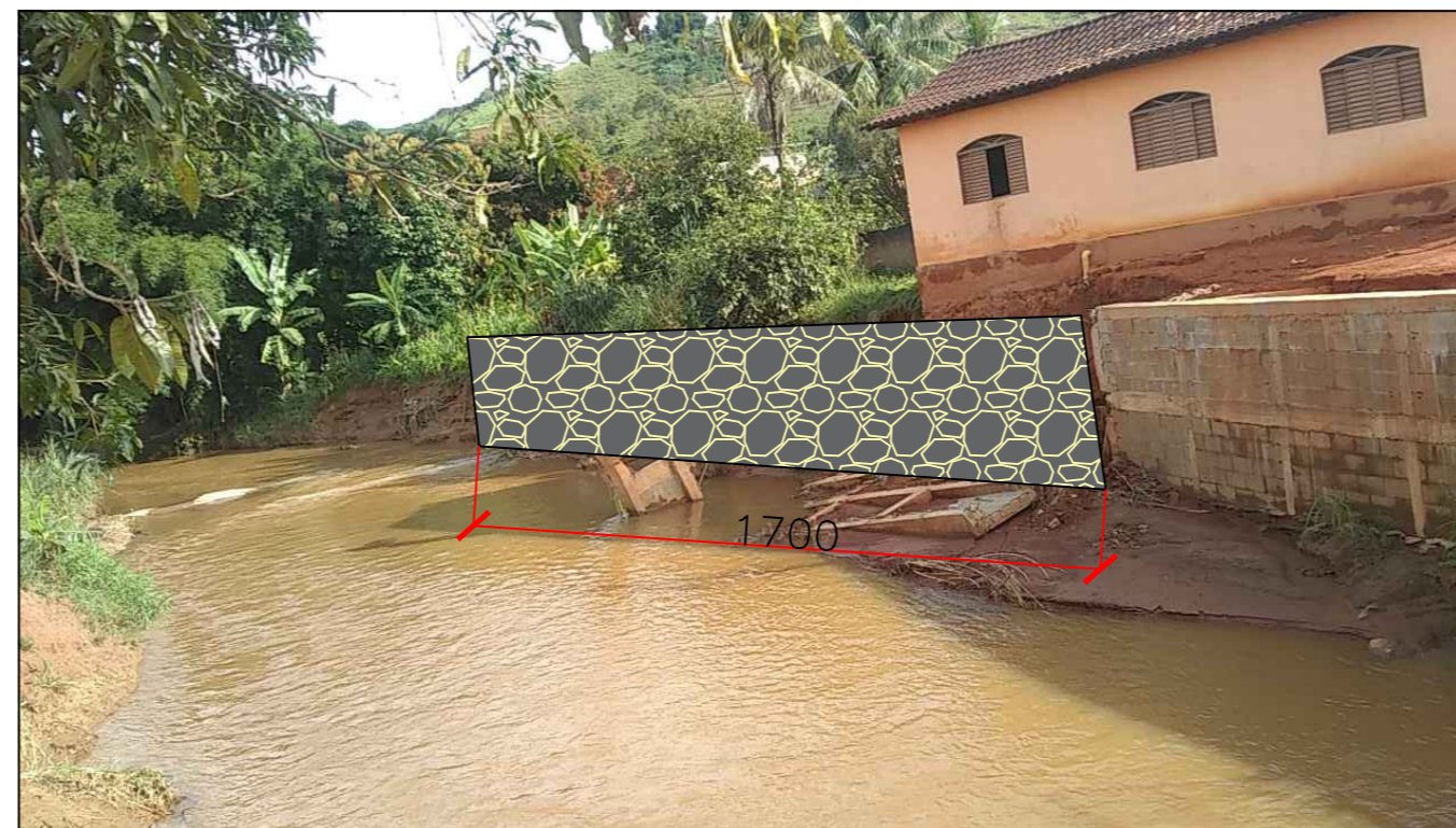
GABIÃO – TRAVESSA MANOEL LANCUNA